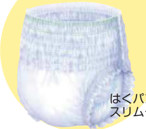
はくパンツ スリムタイプ