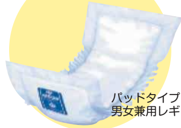
パッドタイプ 男女兼用レギュラー

様々な種類があるので用途に合わせて 正しく使い分けましょう! おむつの相談何でもして下さい!