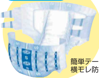
簡単テープ止め 横モレ防止