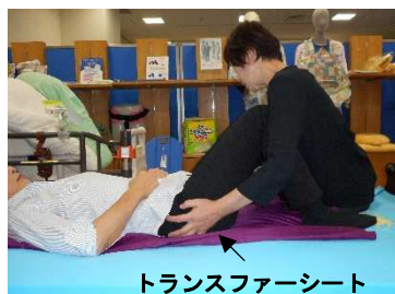
トランスファーシート

常設展示コーナーでは、展示品の更新もしています。このコーナーでは、新しく常設展示に加わったモノの紹介をしていきます。今回は、「トランスファーシート」