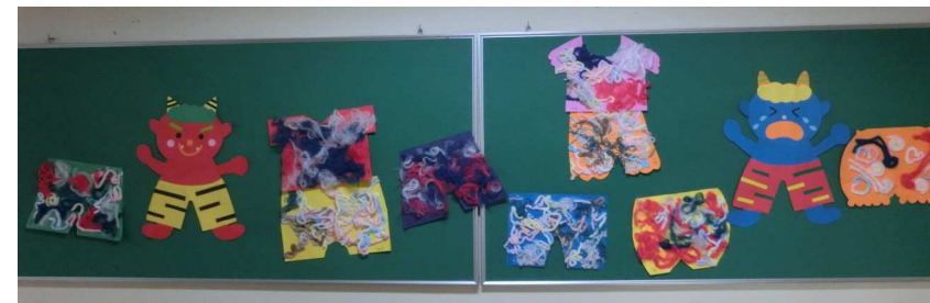
あったかそうな鬼のパンツを作りました (制作)