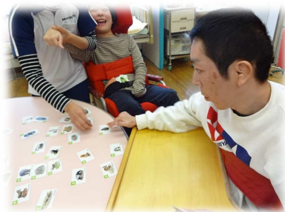
真剣！！ カルタとり遊び & 白熱！！ 羽根つき大会