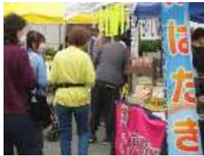
模擬店・フリーマーケット