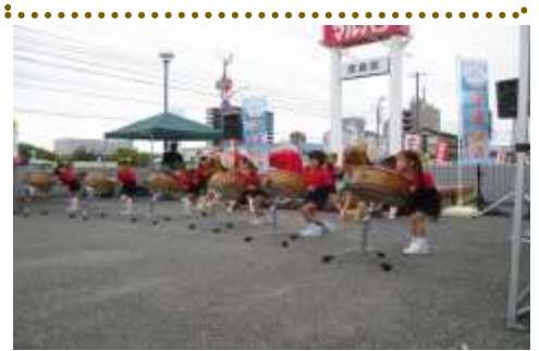
琴浦中認定こども園和太鼓演奏