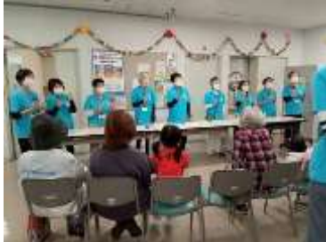
ほっとサポーターによる ミュージックベル演奏