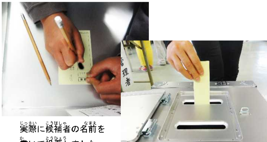
実際に候補者の名前を書き投票しました

折っても折っても開く投票用紙や、選挙のキャラクター「めいすいくん」のお話しもまじえて、選挙制度について楽しく学習しました。