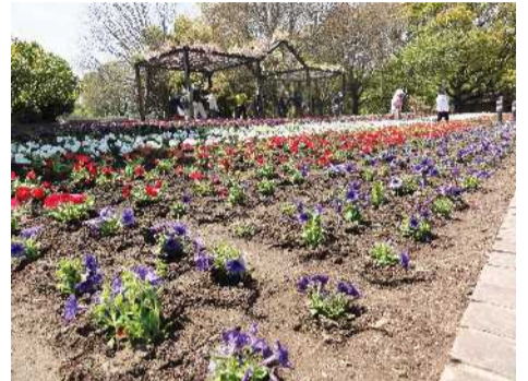
酒津公園植え込み後

えんりようしゃ めい ふじ園利用者 19名 がつ たいしよしゃ めい 4月の退所者 0名 がつ しんき りようしゃ めい 4月の新規利用者 2名