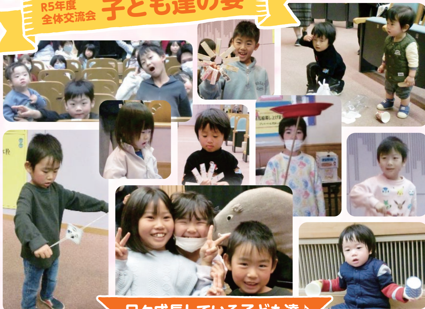
日々成長している子ども達♪